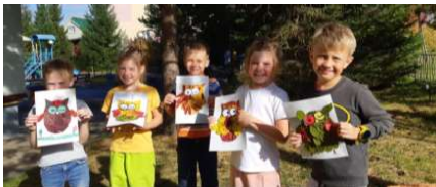
Художественная мастерская «РАДУГА»

После того, как материал был собран, его необходимо высушить. Проще способа, чем сушка листьев в книгах, еще не придумали. Книжные страницы забирают много влаги, и растения за короткий срок становятся сухими и ровными.